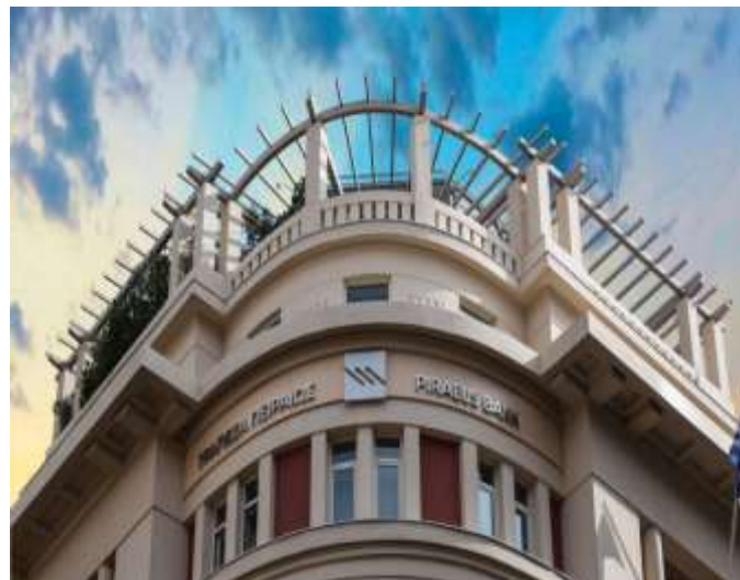
Piraeus Bank Headquarters Αμερικής 4, Αθήνα