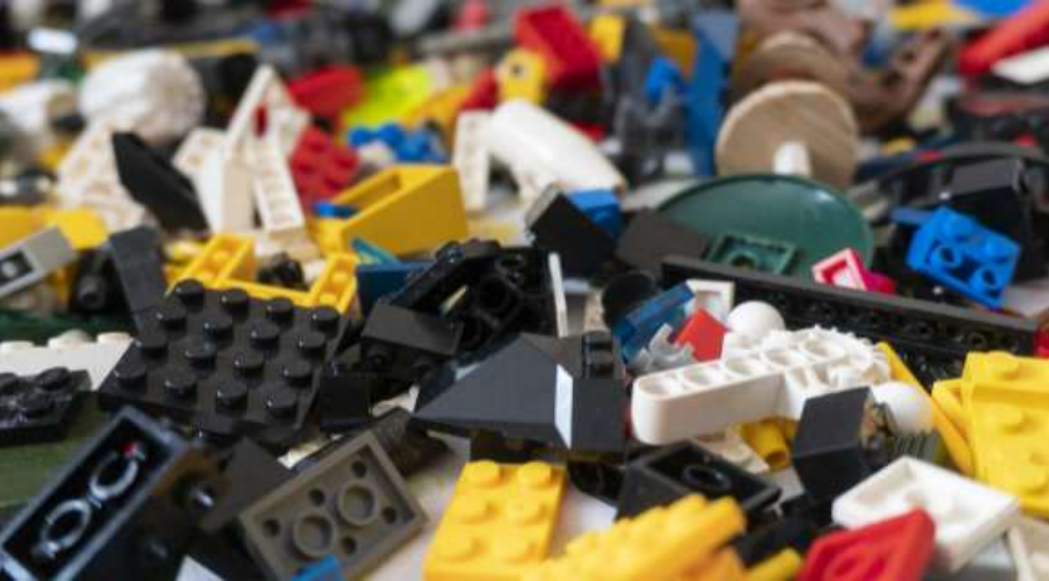
LEGO Serious Play